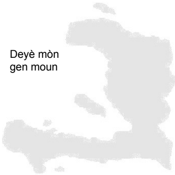
Plate-Forme Haïti de Suisse

« La crise consiste précisément dans le fait que l'ancien est en train de mourir et le nouveau est encore à naître. Et dans l'interrègne, une grande variété de symptômes morbides apparaissent. »